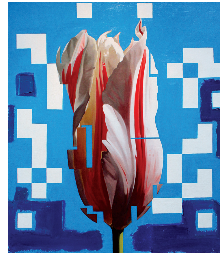
דניאל בורק, טוליפ מס' 1, שמן על בד, 60X70 סמ, 2012 Daniel Bourke, Tulip no 1, oil on canvas 60, X70 cm, 2012