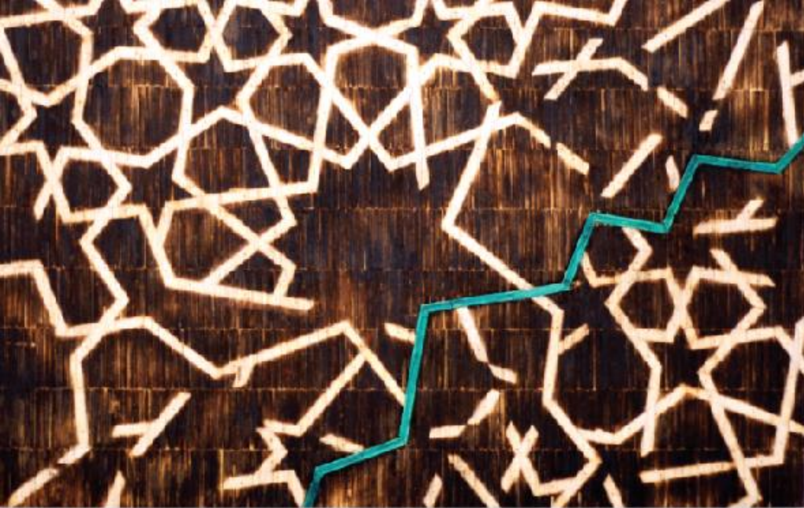
מחמוד קייס, הקו היחיד, טכניקה מעורבת, 50x70 מ"מ, 2012

"הבעיה הביטחונית", "השואה" או "העולם העוין לנצח". זהותו האזרחית של הישראלי מורכבת, ללא כל ספק, מסתירות פנימיות המאפיינות את החברה בכללותה: חיזוק ההגמוניה האורתודוקסית לצד שמירה על הגחלת החילונית, מדינה דמוקרטית לצד אפליה והדרת אוכלוסייה שלמה מכל מעורבות בחיים הכלכליים-חברתיים-מדיניים, צמיחה ועלייה ברמת החיים לצד התחרבותם של פערים חברתיים מדאיגים וכמובן, הפערים האידיאולוגיים בקשר לטריטוריה ושאלת השטחים הכבושים. המושג "זהות" הינו רשת של כל אותן שכבות ורבדים, הארוגה מקודים, מיתוסים, ערכים ואידיאולוגיות, אשר בד בבד משתלבים יחדיו וסותרים ושוללים האחד את השני. שכבה אחת בשנייה, אחת מעל השנייה - ה"זהות" מתנהגת כמעין גוף אמורפי, שמרכיביו מתחברים ומתפרקים ללא הרף, מנסים להתיישב אחד עם השני וברוב המקרים ללא הצלחה ועם ריבוי קונפליקטים. "טרה נובה" דנה באותם קודים, מיתוסים ערכים ואידיאולוגיות אשר חוצים כשתי וערב את השכבות