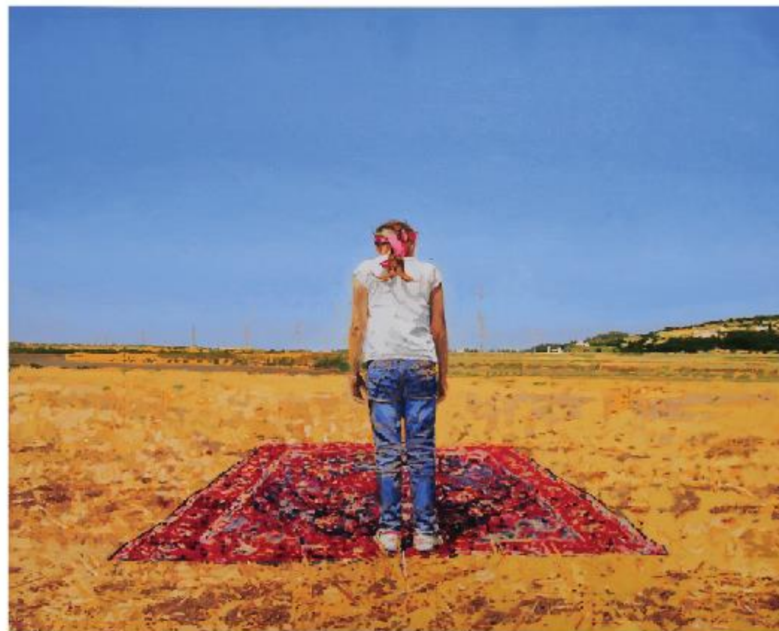
פאטמה שגאן, המראה, שמן על בד, 100x80 סמ', 2012

לה יחדיו באמצעות הזרז הציוני, כך גם התרבות הערבית מומסת ומתמוססת אל תוך הישראליות. רצונו של האמן "להסתגל" יכולה להיות מתוך בחירה, אך גם מתוך חוסר ברירה. דימוי "הפועל הערבי" אשר עוצב על ידי האוכלוסייה היהודית רק מחזק את הדיסונאנס הפנימי של פחד בקשר לזהותו האזרחית. האדמה המובטחת, האוטופית והמטפורית - מי הבטיח אותה ולמי?